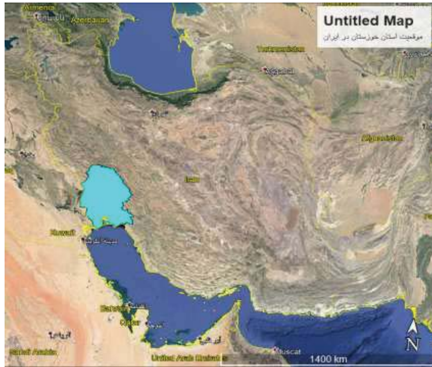
شکل ۱: موقعیت استان خوزستان در ایران